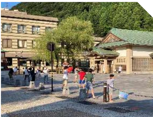
ラジオ体操 (山中座前)

各町では小学生の数が減少し、子ども会活動が困難になっていきますが、8月24日には開催時間や運営方法を工夫しつつ、「地藏盆」が開催されました。