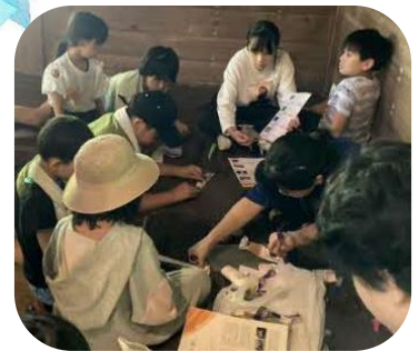
(上) 中学生が工作指導