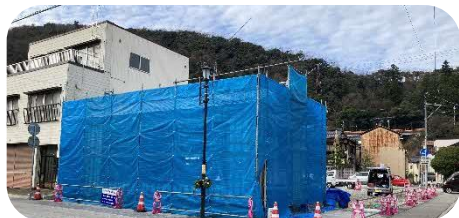
山中温泉ししがしらんど

両広場とも、3月10日に開園の予定で、今後、住民や観光客の憩いの場であるとともに、まちなか拠点のひとつとして、山中温泉のにぎわい創出において期待されます。